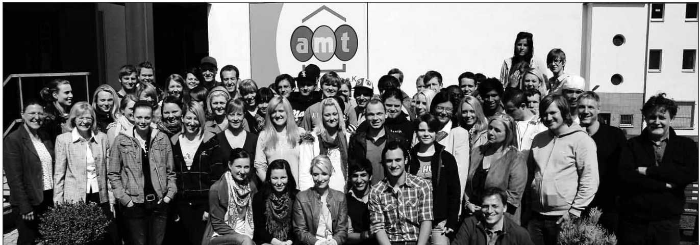
Fit für den Arbeitsmarkt: Schüler und Dozenten der „amt“-Akademie feiern 25-jähriges Jubiläum.